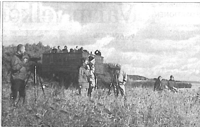
Den farvestrålende isfugl gæster jævnligt Nivå Bugt Strandenge, hvor det af og til sker at man kan nyde den i ro og mag fra fugletårnet, hvor den fisker i styrtdyk. Netop søndag den 14. august vil frivillige hjælpe tårnets gæster.

skolerne pludselig har mange ting, der skal honoreres. I forhold til skolereformen har kommunen været langt fremme, og vi har været med i et pilotprojekt med anti-mobning - og det har fået os til at tage vores antimobningsstrategi frem og finpudse den. Så selvom det kan være hårdt arbejde, er det også fint, at skolerne hele tiden bliver pustet i nakken for at gøre det bedre - ellers er det ikke sikkert, at vi ville have så fine tal i dag efter mange års indsats.