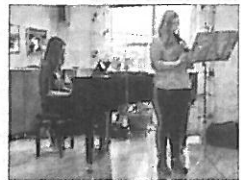
Musikcafékoncerten den 9. marts starter kl. 19.00, er åben for alle og gratis at overvære.

Publikum kan glæde sig til soloviolin og violinkvartet, samt klassikeren »I know him so well« fra musicalen Chess for klaver. Desuden kan tilhørerne opleve 4-hændig musik af Diabelli, små sange for guitar, Beethovens »Måneskinssonate« og en arie fra operaen »Orpheus« for blokfløjte og klaver.